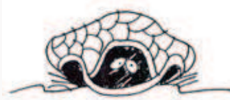
安全主義の殻に閉じこもれば進歩はない