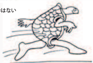
飛び出してレースに参加しよう