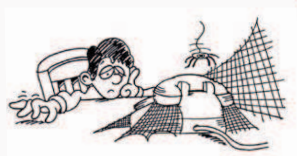
始動する勇気がなければ、チャンスはこない